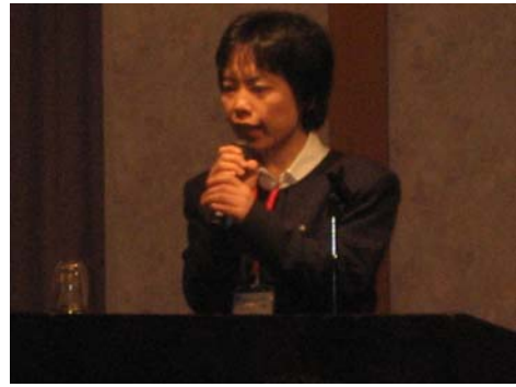
南魚沼地域振興局 医療予防課より講師を招いての研修会