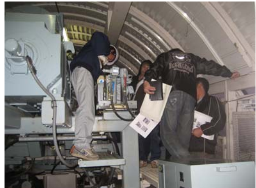
自動循環式索道の予備原動装置の取扱い救助訓練