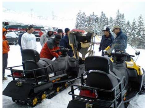
スノーモビル安全運転取扱い講習会